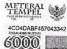
PUTU WINASTRA, S.Sos